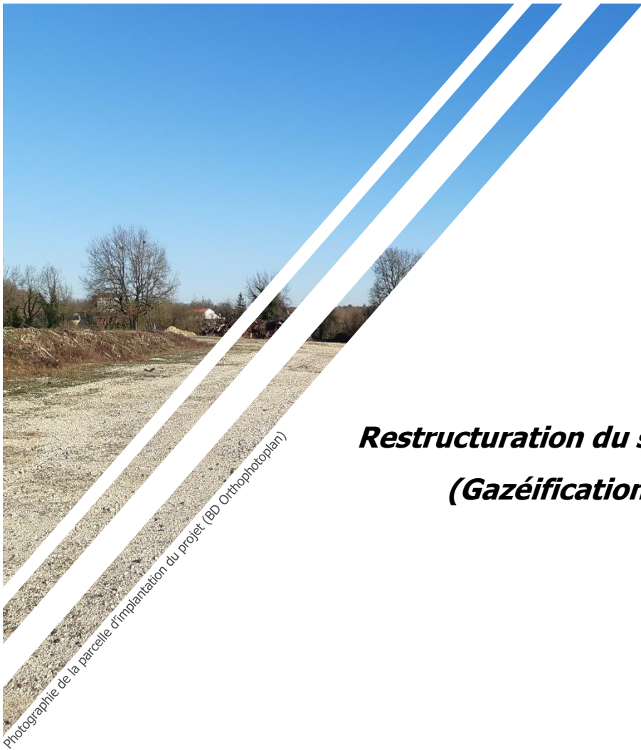
Photographie de la parcelle d'implantation du projet (BD Orthophotoplan)